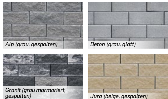
Alp (grau, gespalten)