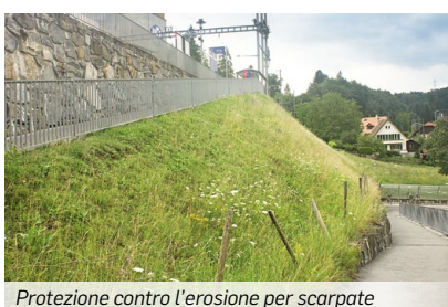
Protezione contro l'erosione per scarpate