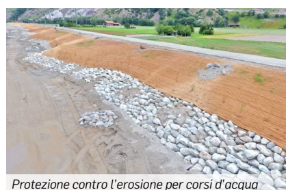
Protezione contro l'erosione per corsi d'acqua