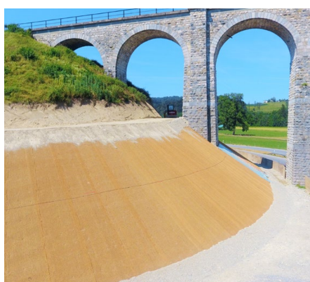
Protezione contro l'erosione per infrastrutture

ausilio temporaneo di attecchimento. Le geocel- lule e le geostuoie strutturali in plastica e acciaio forniscono una sorta di armatura permanente per il manto vegetativo e garantiscono una protezione durevole contro l'erosione e la caduta massi. Ciò consente di soddisfare i requisiti per un rinver- dimento duraturo anche in luoghi con situazioni difficili.