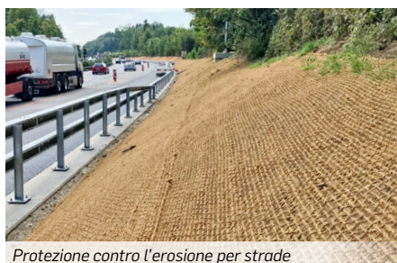
Protezione contro l'erosione per strade