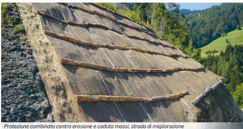
Protezione combinata contro erosione e caduta massi, strada di miglioramento