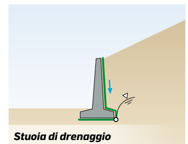
Stuoia di drenaggio